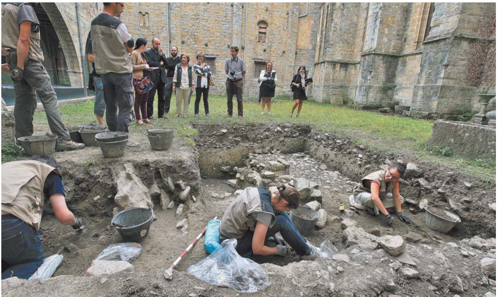
Arqueólogos excavan en un claustillo de la Catedral, donde aparecieron restos romanos. El edificio visigodo se halló en otra zona, bajo el interior del templo.