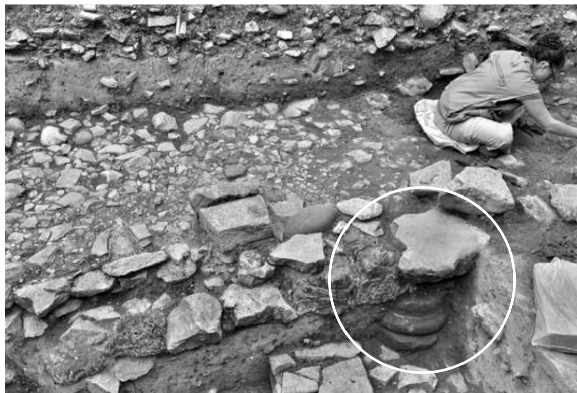
En uno de los sondeos del claustro se aprecia la base de una columna de la época altoimperial (siglos I-II), que probablemente perteneció a una rica domus (casa romana).