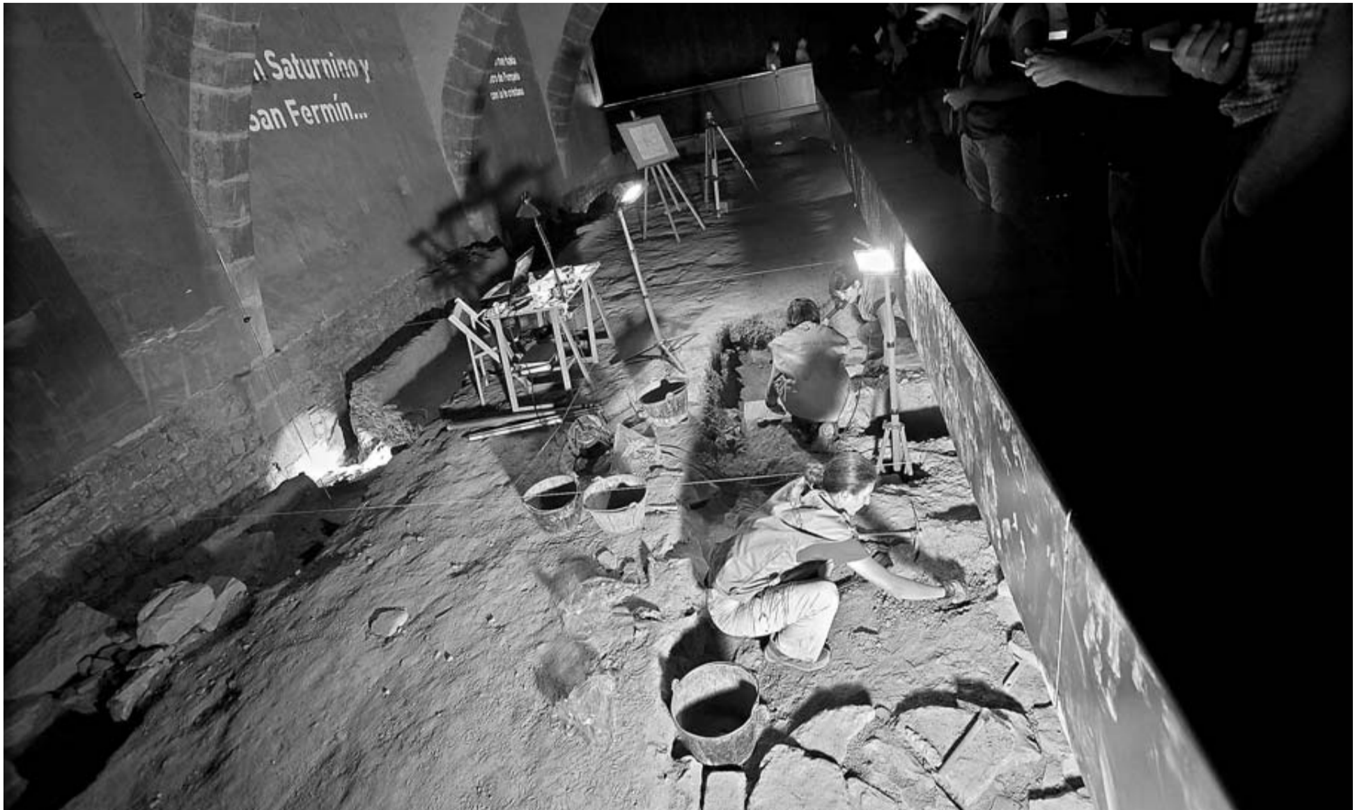
Varios arqueólogos, trabajando ayer en el yacimiento de la sala de arqueología de Occidens , cuyo tamaño se corresponde con el del edificio visigótico (7x25 metros).